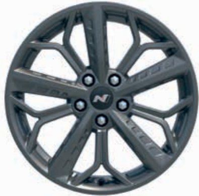
18 inç alaşım jant