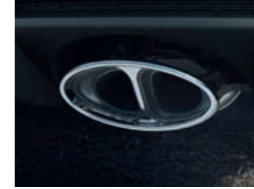
Spor Egzoz Sistemi

Direksiyon simidindeki kırmızı düğme ile etkinleştirilen devir eşleştirme sistemi, vites küçültürken motor devrini otomatik olarak artırır, optimum vites değişiklikleriyle sportif vites değişimini sağlar.