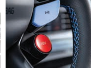
Rev Matching - Devir Eşleştirme Sistemi

Diferansiyel kilidi keskin virajlarda bile mümkün olan en iyi kavrama için ön tekerleklere güç aktarımının mekanik olarak kontrol edilmesini sağlar.