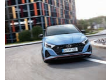
M-LSD Mekanik Sınırlı Kaydırmalı Diferansiyel

Diferansiyel kilidi keskin virajlarda bile mümkün olan en iyi kavrama için ön tekerleklere güç aktarımının mekanik olarak kontrol edilmesini sağlar.