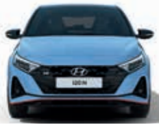
Ön İz Genişliği: 1.544 Toplam Genişlik: 1.775