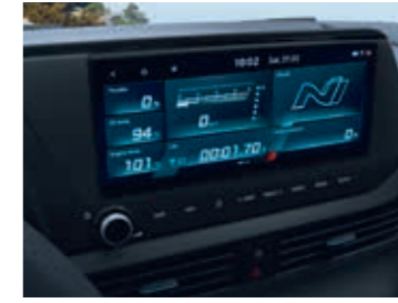
Performans Sürüş Veri Sistemi