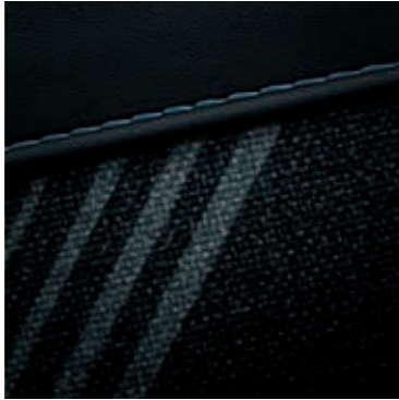
Siyah iç mekân ve siyah tavan döşemesi