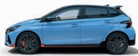
Aks Mesafesi: 2.580 Toplam Uzunluk: 4.075