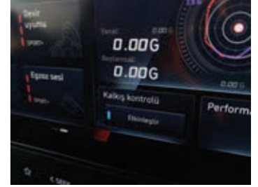
Kalkış Kontrol Sistemi (Launch Control)

Değişken susturucu kontrolü, mükemmel egzoz sesini oluşturmanıza olanak tanır.