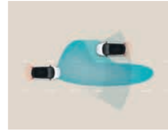
Gelişmiş Aktif Güvenlik özellikleri